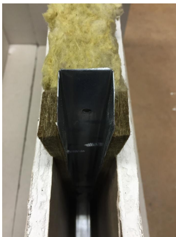
Con correzione termoacustica NOBILIUM®THERMOSILENT

Il prodotto NOBILIUM®THERMOSILENT è un prodotto naturale e 100% riciclabile AGOSTI NANOTHERM SRL - Via San Giacomo 23 - 39055 Laives ( BZ ) - ITALY